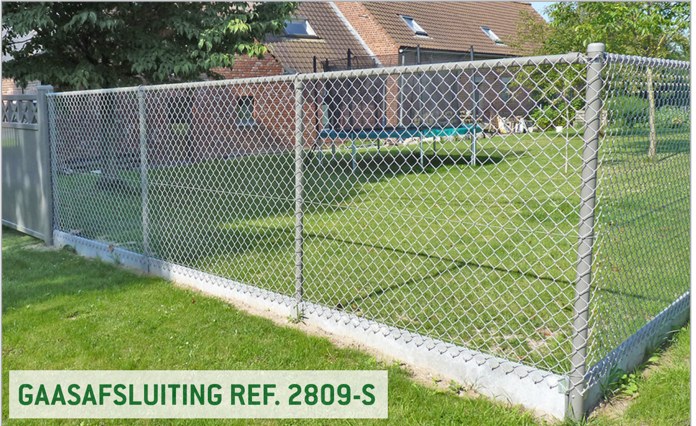
GAASAFSLUITING REF. 2809-S