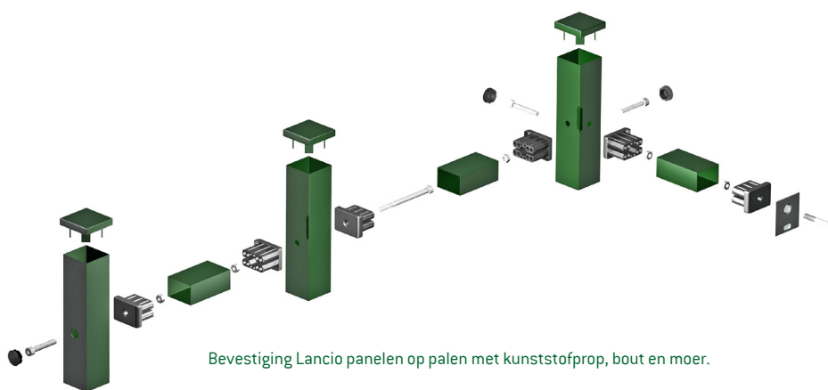
Bevestiging Lancio panelen op palen met kunststofprop, bout en moer.