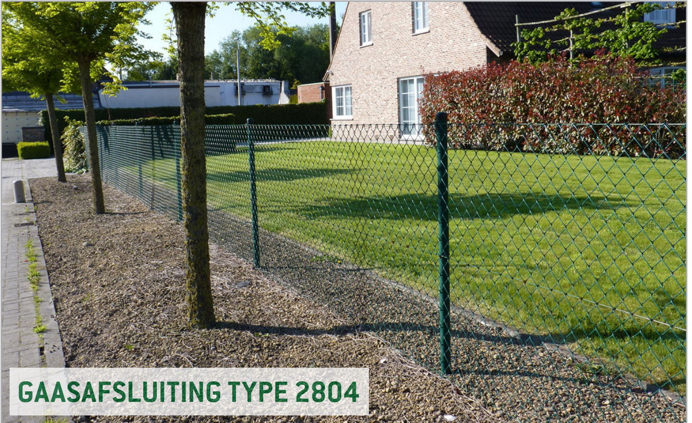
GAASAFSLUITING TYPE 2804